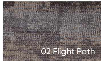
02 Flight Path